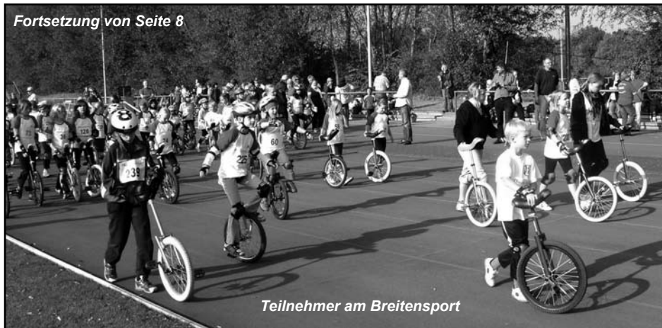
Teilnehmer am Breitensport

ren viele, viele Aufgaben, Zelte, Bänke, Tische, 1. Hilfe-Versorgung, Maßbänder, Würstchen und Getränke. Die elektronische Messeinrichtung hat uns dankender Weise der SiB-Club zur Verfügung gestellt.